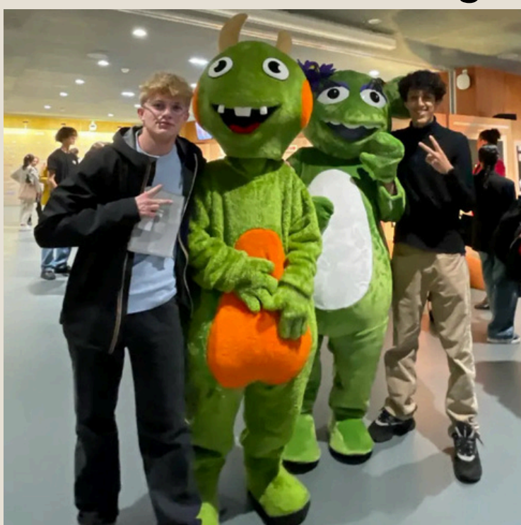
La rencontre avec les mascottes de la Cosmetic Valley a ajouté une touche amusante à l'expérience.