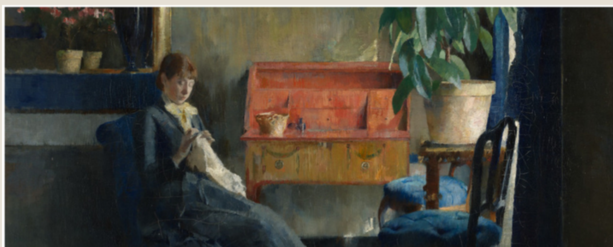
Harriet Backer (1845 - 1932) Intérieur bleu, 1883

Ils ont pu développer leur esprit critique, leur connaissance du troisième art.