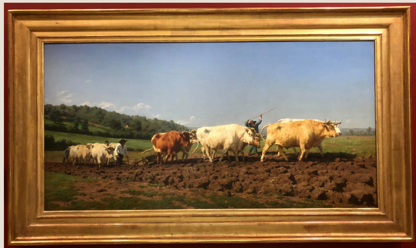
Ivan Jablonka, Le travail aux champs, en 1849

Mise en musique d'une bande dessinée, cette représentation retrace la vie d'un banc . Un banc public dont la vie est modelée par les gens de passage à travers le temps qui défile au rythme des journées, des saisons, des années.